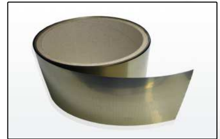
EMV-Abschirmungen (Seiten 11-12)