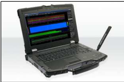
Outdoor Analyzer (Seite 4)