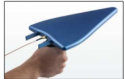
Peilantennen (passive: Seite 6, aktive: Seite 7)