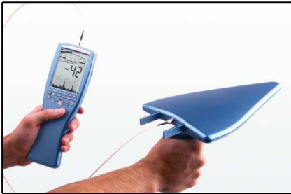
HandHeld Analyzer (Seite 2)