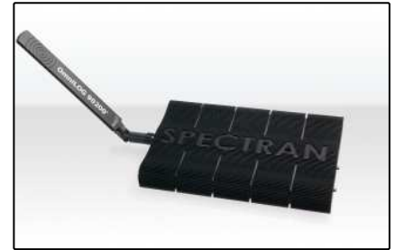
USB Analyzer (Seite 4)