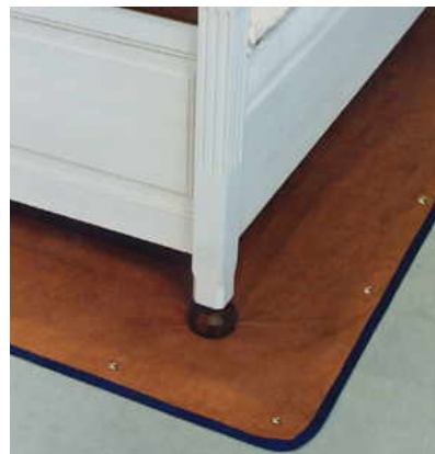
Abschirmmatte aus Aaronia X-Dream®