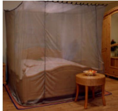
Kasten-Abschirmbaldachine aus Aaronia-Shield® bieten höchste Abschirmung gegen NF- und HF-Belastungen

Anzumerken ist auch, dass Baldachine aus Aaronia-Shield® für eine Hochfrequenz-Abschirmung nicht geerdet werden müssen! Wir empfehlen aber generell eine Erdung mit unserer jeweils dazugehörigen Abschirmmatte, da so auch noch niederfrequenter Elektrosmog von Stromleitungen, Hochspannungsleitungen etc. abgeschirmt wird.