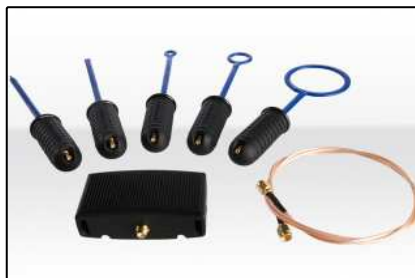
Schnüffelsonden (Seite 10)