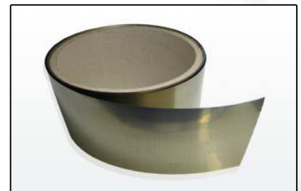
EMV-Abschirmungen (Seiten 11-12)