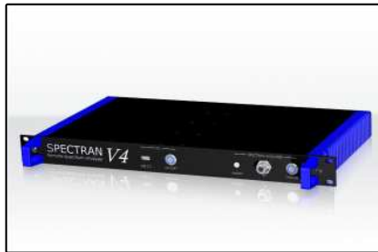
Rack Mount Analyzer (Seite 5)